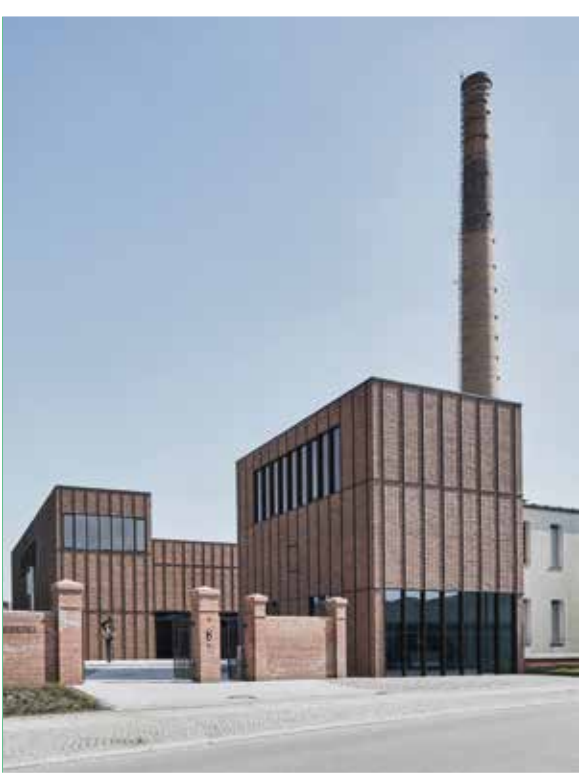
KULTURWEBEREI, FINSTERWALDE HABERMANN ARCHITEKTUR