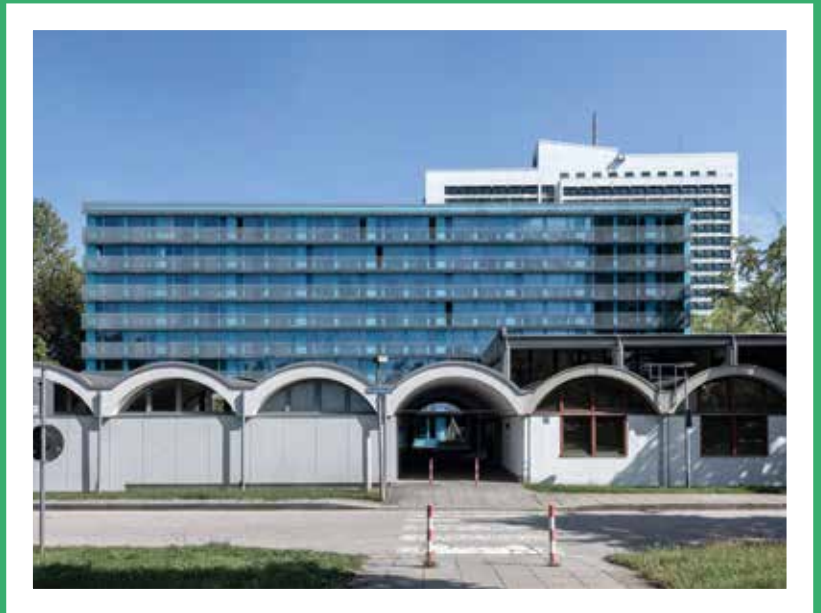
SOPHIE-SCHOLL-HAUS – SANIERUNG STUDIARENDEWOHNHEIM, MÜNCHEN MUNICH BOGEVISCHS BUERO